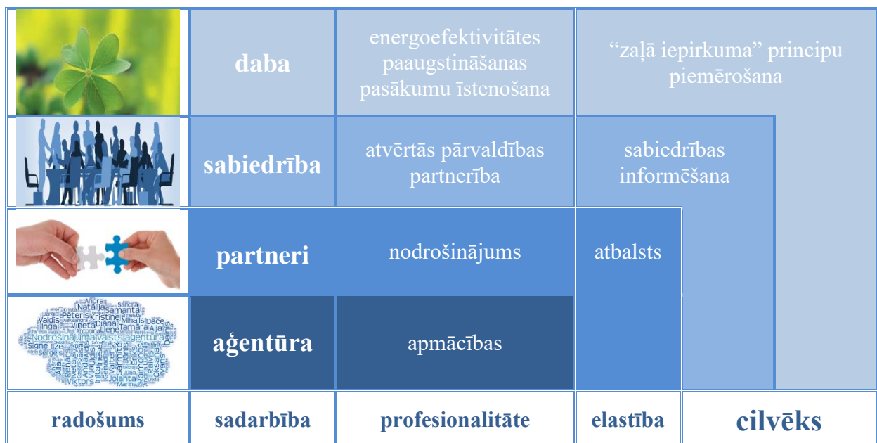
Aģentūras KSA dimensiju karte

Ievērojot korporatīvās sociālās atbildības (turpmāk – KSA) attīstības tendences Eiropas Savienībā un Latvijā, kā arī īstenojot politikas plānošanas dokumentos izvirzītos sociālos, ekonomiskos un ekoloģiskos mērķus un noteiktos rīcības uzdevumus, aģentūra iesaistās KSA aktivitātēs (dalība valsts un Iekšlietu ministrijas mēroga kultūras, vēstures un sporta pasākumos, veicinot nacionālo vērtību attīstību un saglabāšanu; nodarbināto sociālā aizsardzība, veicinot labklājības paaugstināšanu un stiprinot lojalitāti pret iestādi; darba vides risku samazināšana vai novēršana, organizējot drošu darba vidi u.c.), atbalsta KSA labo praksi un veicina katra nodarbinātā sociālās atbildības celšanu.